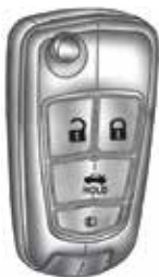
FOB Key Button Description